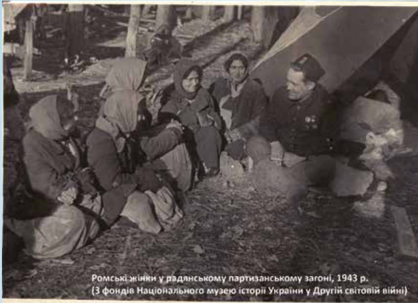
Ромські жінки у радянському партизанському загоні, 1943 р. (З фондів Національного музею історії України у Другій світовій війні)

Проект виконується спілкою «Освітня ініціатива з роботи заради миру» у Берліні спільно з Українським центром вивчення історії Голокосту в Києві. Важливою складовою є тісна співпраця з місцевими та обласними ромськими громадськими організаціями.