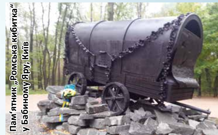
Пам'ятник „Ромська кибитка“ у Бабиному Яру, Київ